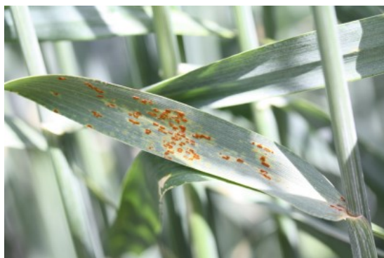
Billede 3. Brunrust i rug.

Kontakt din lokale rådgivningsvirksomhed , hvis du vil vide mere om dette emne.