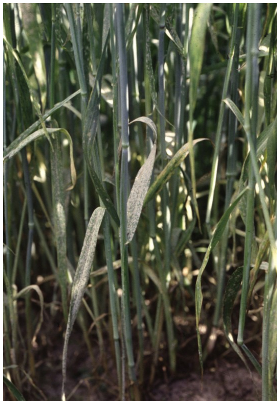
Billede 1. Meldug i rug.